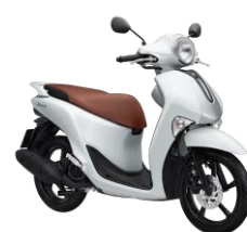
Trắng Bạc bóng