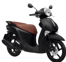
Đen Xám nhám