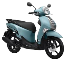
Xanh Xám nhám