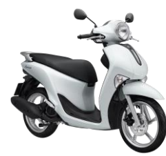
Trắng Đen bóng