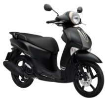
Đen Vàng nhám